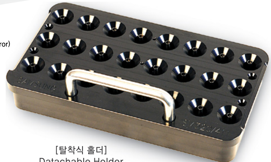
[탈착식 홀더] Datachable Holder