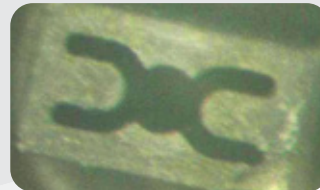
[세척후 After Cleaning] 백화현상 제거 (비전에러 없음) Removal of Whitening (No Vision Error)