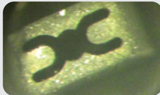
[세척전 Before Cleaning] 백화현상 (비전에러 유발) Whitenint (Causing Vision Error)